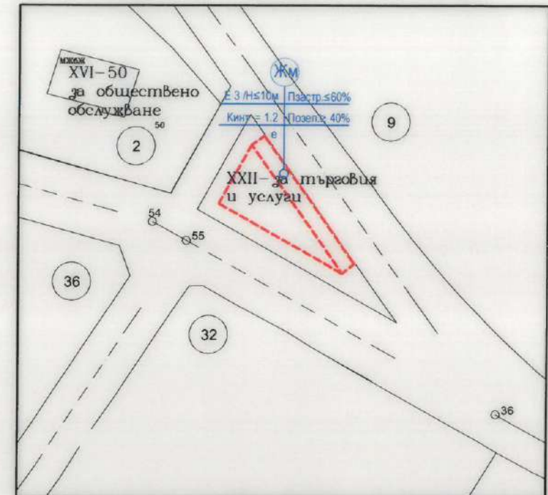
ПЛАН ЗА ЗАСТРОЯВАНЕ на УПИ XXII - за търговия и услуги кв. 2 по плана на с. Славовица, общ. Септември