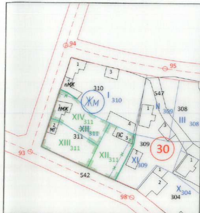
ИЗМЕНЕНИЕ НА ДЕЙСТВАЩИЯ РЕГУЛАЦИОНЕН ПЛАН