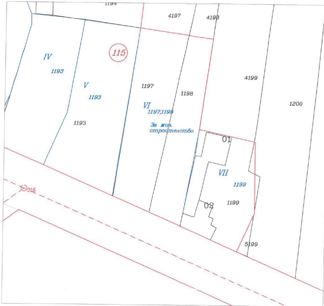
Извадка от регулационен план на гр. Ветрен

ОДОБРЯВАМ със заповед № 30 ..... 19.04.2023 г. КМЕТ: ..... ОБЩИНА СЕПТЕМВРИ КМЕТ