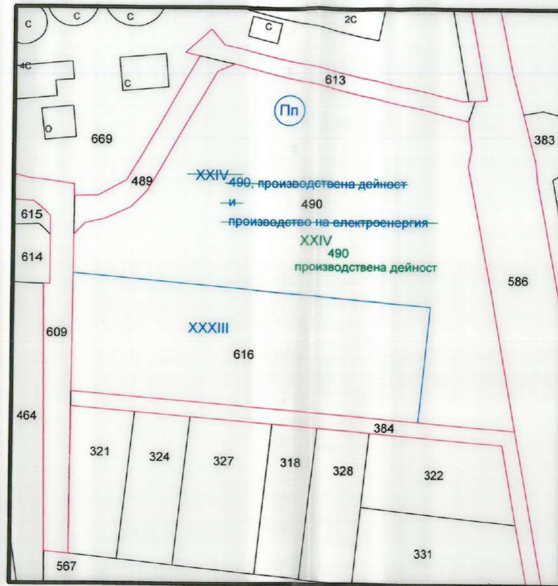
ИЗМЕНЕНИЕ НА ПЛАН ЗА РЕГУЛАЦИЯ М 1:1000 за УПИ XXIV-490 по плана на гр. Септември, местност "Адата"