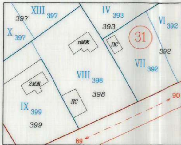
ИЗВАДКА ОТ ПЛАНА ЗА РЕГУЛАЦИЯ на част от кв. 31, с. Варвара